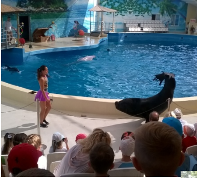
Дельфинарий «Немо» посетили первоклассники

В гимназии «Росток» уже третий год внедряется уникальный долгосрочный проект «Образование в путешествии»: каждую пятницу в сентябре и мае учащиеся с родителями и преподавателями отправляются на экскурсию в одно из многочисленных интересных мест нашего края. Обо всех путешествиях подробно рассказывают статьи на сайте гимназии, а мы представляем краткий обзор.