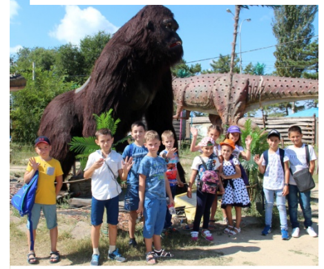
В гостях у динозавров был 3 Б Поездка в парк живой природы «Додо» - настоящий подарок для первоклассников!