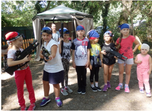
Даже старшеклассники не удержались и отправились в «Город роботов», в названии которого они заметили что-то «родственное». Там побывал и 4 Б.

5А, 7А и 7Б поехали в п. Возрождение г.Геленджик, чтобы посетить прекраснейший уголок природы - дольмены и водопады реки Жане.